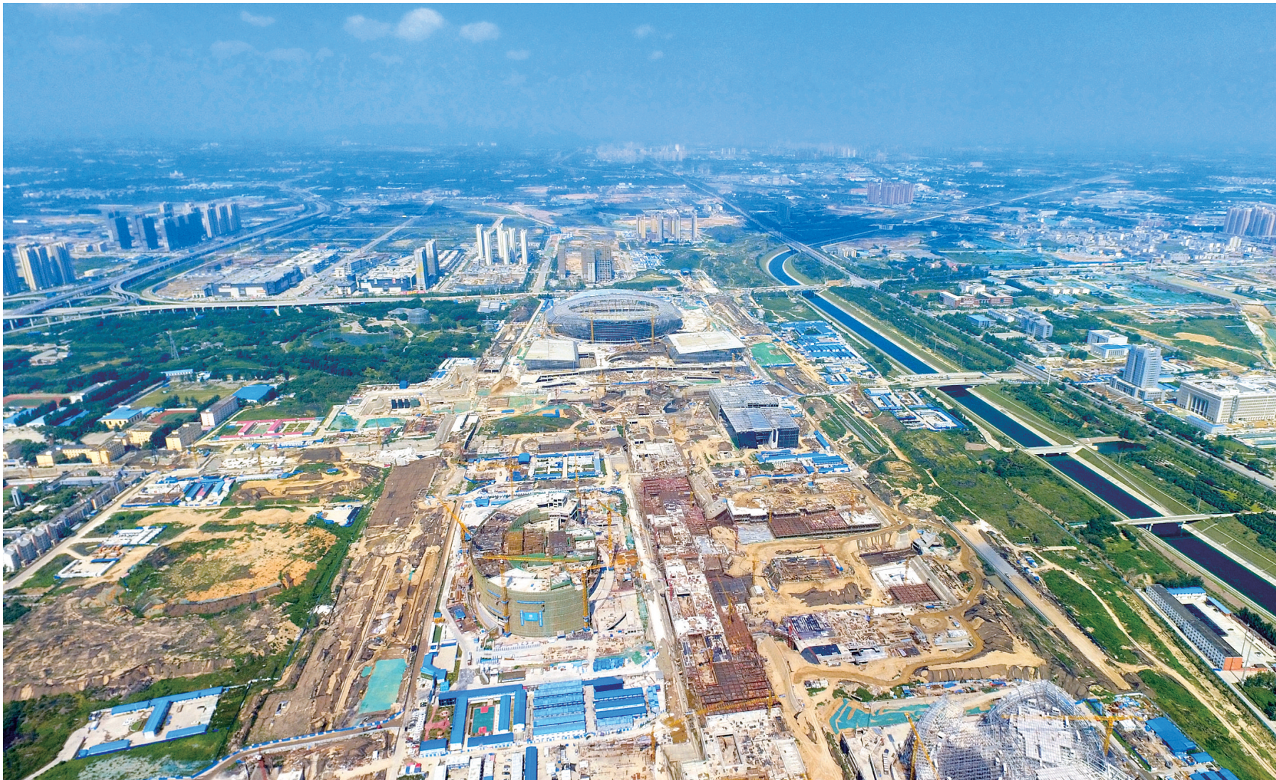
湛蓝的南水北调干渠穿过 CCD,旁边的奥体中心主体已经建成

目前,郑州中央文化区(CCD)建设有条不紊地进行着,7月20日上午,本报记者用无人机拍摄下繁忙的建设场景。