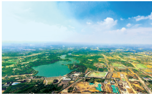
中央文化区(CCD)毗邻常庄水库