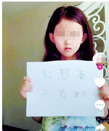
儿童在视频里求关注

正值暑期,不少孩子的休闲方式都少不了网上娱乐。近日,多名家长向媒体反映,自家孩子不仅沉迷“抖音”等网络平台,而且为了涨粉无所不用其极。短视频APP的流行,让许多孩子形成了一种新型的网瘾,过早面对在他们这个年龄还看不懂的成人世界。