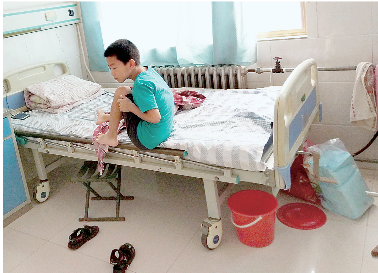
七岁男孩独自在医院内