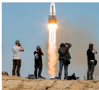
摄影师拍摄载人飞船的发射