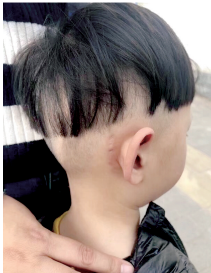
男童耳部植入耳蜗留下的痕迹