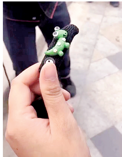
失而复得的人工耳蜗

本报讯(记者 徐富盈 文/图)昨天,一条寻物消息刷屏了郑州人的微信朋友圈!这个“物”有点不一般,它是一名3岁男童的人工耳蜗。最终,昨天下午2时40分许,捡到人工耳蜗的女子委托亲友把人工耳蜗转交给男童妈妈。