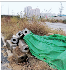
东三环与商都路交叉口

高铁沿线有些地方垃圾满地、道路两侧绿化带里杂草丛生、工地围挡“颜值”不美观……这是昨天记者在郑东新区走访发现的问题。本报记者