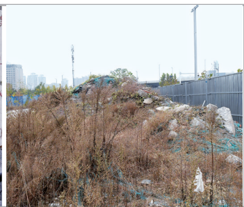
陇海铁路北七里河路南侧