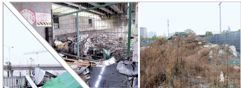
京广高铁立交桥下