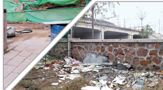
莲湖路与京广高铁交叉口