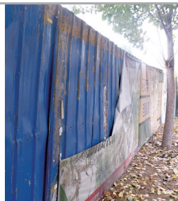
篮球公园施工围挡