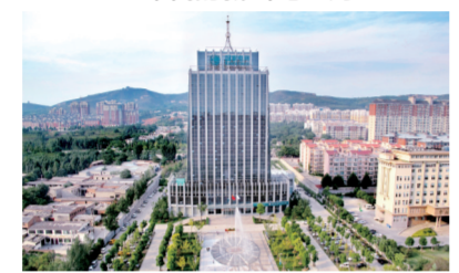
如今的新密市电业局大厦