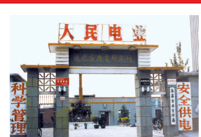
上世纪70年代的新密电业局

据悉,改革开放40年以来,新密市从“黑色”向“绿色”、从“资源型”向“生态型”转变,累计造林20.5万亩,建设青屏山、九里山、圣水峪等森林公园17个,绿化廊道79条570.8公里,绿化面积4835万平方米,全市森林覆盖率达到43.96%。昔日的乌金之乡新密,已经悄然蝶变。特别是近几年来,新密市委、市政府践行新发展理念,坚持改造提升传统产业,培育壮大新兴产业,支持发展高端制造业,大力扩张现代服务业。全市创成省级生态乡镇10个、省级生态村52个、郑州市级生态村61个。生态环境变好了,生态旅游火了起来,不仅让当地人流连忘返,也引来大批外地游客。乐游华夏圣地、乐闲千年古城、乐养岐黄圣境成为全域旅游的三张名片。 记者 薛璐 /文