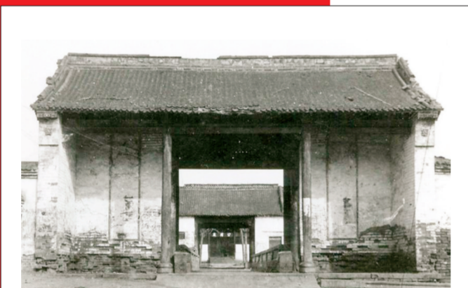
上世纪的密县县衙曾是县政府办公地