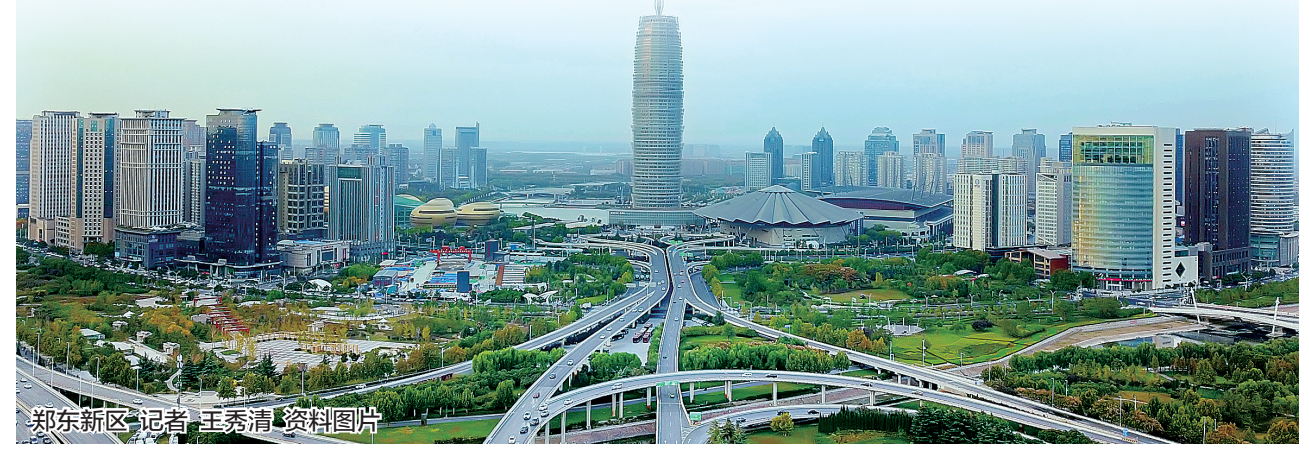
郑东新区 记者 王秀清 资料图片

城市建成区内的重污染工业要按时按点改造或者搬迁 本报讯(记者 李娜) 实施城市建成区内生产过程中污染物排放量大且不符合城市总体规划、功能分区的工业企业搬迁改造,是改善城市大气环境质量、优化城市工业布局、提升城市综合竞争能力的重要手段和迫切任务。1月1日,记者从省政府获悉,省政府办公厅印发了《关于推进城市建成区内重污染工业企业搬迁改造的指导意见》,列出了该项工作的时间节点。具体来说,2022年底前城市建成区内重污染企业分类完成就地改造、退城入园、转型转产或关闭退出任务,企业绿色发展水平大幅提高,城市大气环境质量显著改善。其中,就地改造企业2019年上半年启动改造工作,2020年底前完成;转型转产企业2019年上半年启动转型转产工作,2021年底前完成;退城入园企业2019年底前启动搬迁工作,中小型企业2022年底前完成,大型和特大型企业2025年底前完成;关闭退出企业2020年底前完成关闭退出工作。