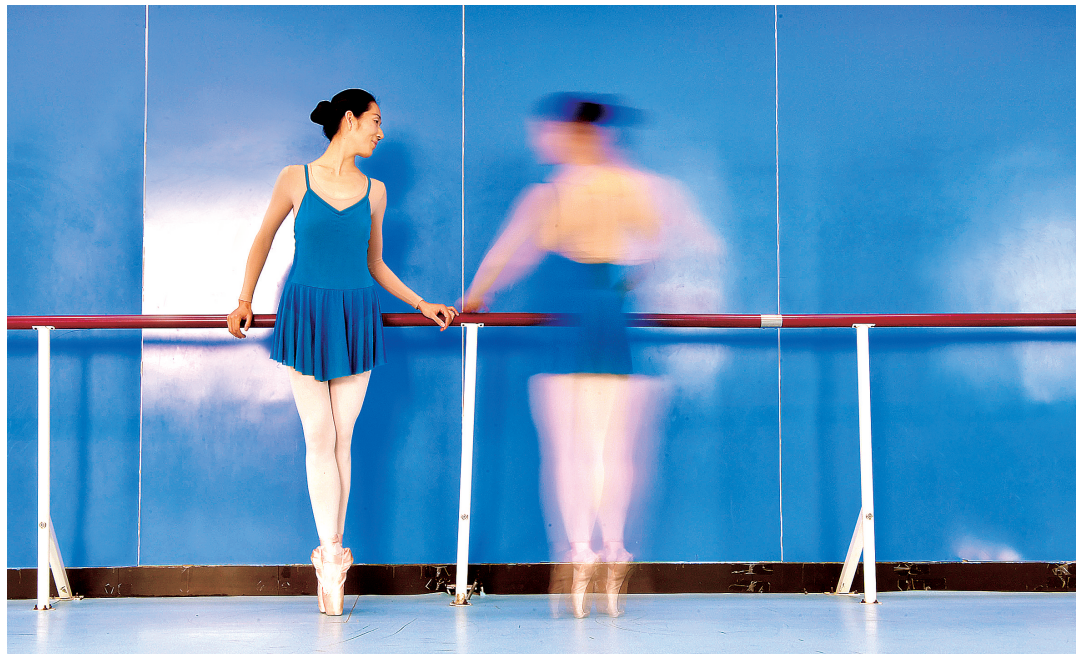
《芭蕾追梦》2018年1月13日,郑州一群平均年龄55岁的大姐,凭借努力在不到一年的时间实现了芭蕾舞梦。