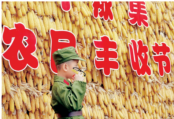
《喜迎佳节》2018年9月20日,郑州迎接首个农民丰收节。