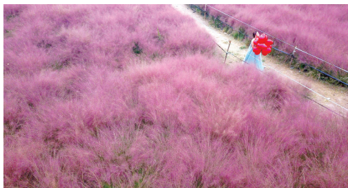
《粉色秋天》2018年10月,粉黛乱子草再次成为“网红”。