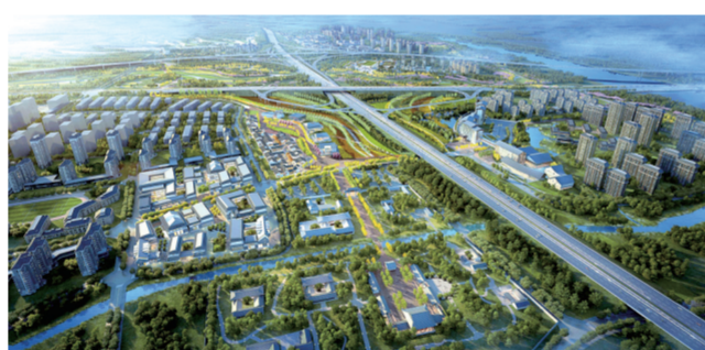
巩义诗瓷小镇——诗圣杜甫国家文化公园鸟瞰图

全面配合巩义市重点项目的建设,积极协调东高速口扩宽、河图路、第二污水处理厂、四河一库建设、入河口排污口封堵、高铁沿线生态廊道建设等工程,为项目的顺利推进提供征地拆迁、协调服务等工作。