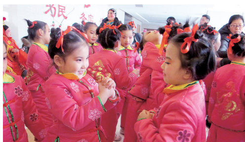
用镜头留住“田园春来早”中牟县2019迎新文艺汇演的精彩瞬间。