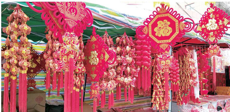
春节临近,荟萃路呈现浓浓的中国年味。魏秀勤 摄