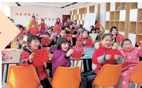
1月26日,姚集镇开展“迎新春送祝福,热热闹闹过大年”手工剪窗花活动。