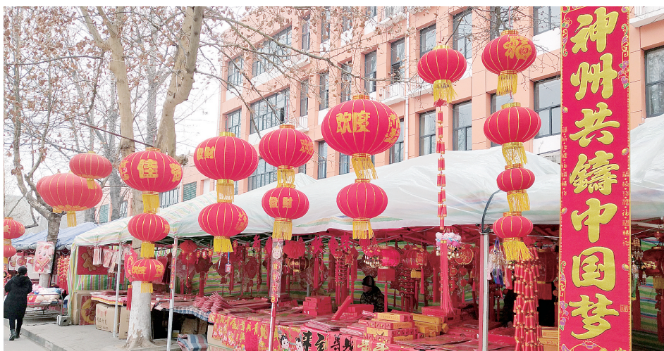
1月28日,红色的灯笼、红色的春联,预示着新的一年老百姓的日子红红火火。张俊峰 摄

盛世抬头迎旭日,猪年挥手舞春风。近日,中牟县一派喜气洋洋的景象,买春联、挂灯笼、穿新衣、购年货,处处洋溢着浓浓的年味,人人沉浸在辞旧迎新的喜悦中。 中牟时报 马沂峰