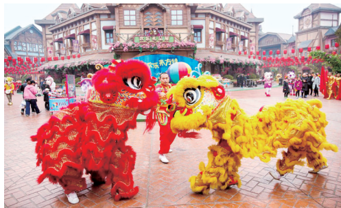
近日,郑州方特旅游度假区“方特中国年”活动开幕,特色民俗活动受到游客欢迎。