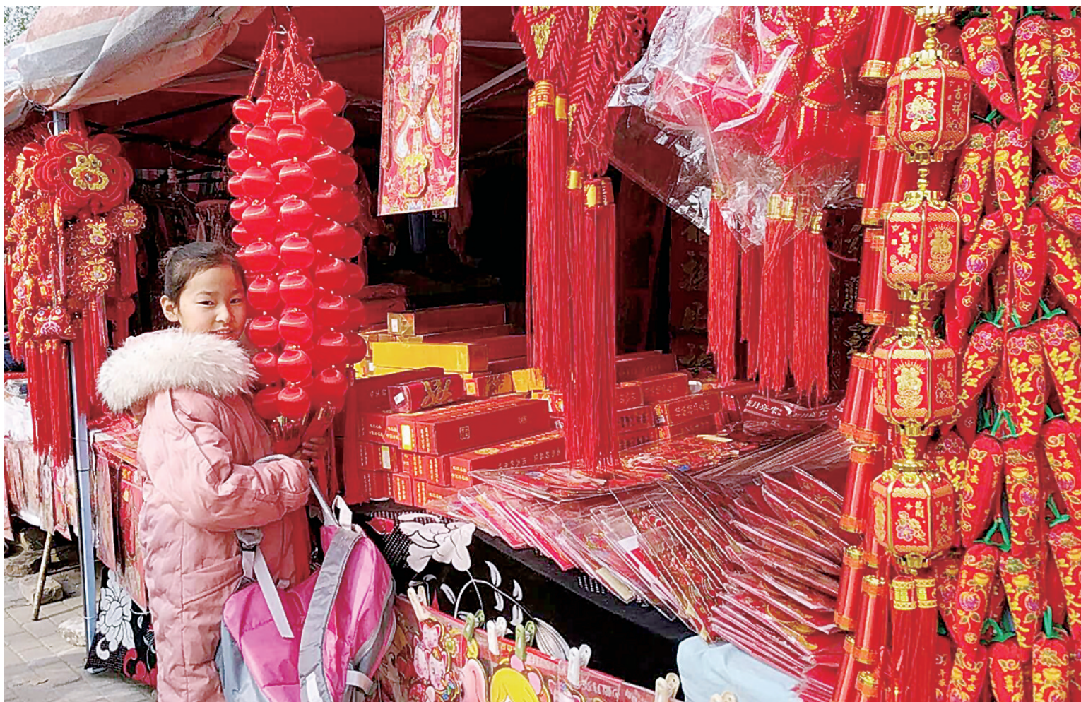
1月27日,年货一条街上,一个小姑娘看到喜庆的物件很开心。韩娟 摄

盛世抬头迎旭日,猪年挥手舞春风。近日,中牟县一派喜气洋洋的景象,买春联、挂灯笼、穿新衣、购年货,处处洋溢着浓浓的年味,人人沉浸在辞旧迎新的喜悦中。 中牟时报 马沂峰