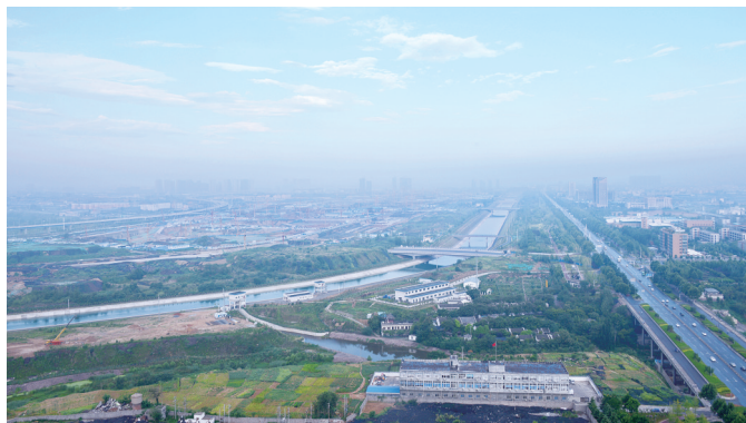
生机勃勃的中原区