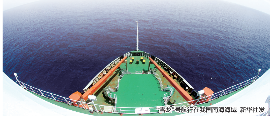
“雪龙”号航行在我国南海海域

次会晤后,朝鲜或将做出决定,显示其是否有诚意与美国对话并致力于实现朝鲜半岛无核化。如果朝方不愿这么做,美国不仅不会解除对该国制裁,还将在制裁措施上寻求“加码”。据新华社