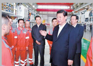
2014年5月10日上午,习近平在中铁工程装备集团有限公司盾构总装车间同现场职工亲切交流。