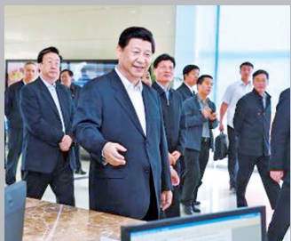
2014年5月10日上午,习近平在河南保税物流中心考察。