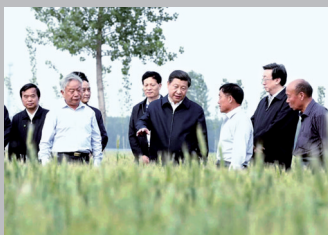
2014年5月9日,习近平在河南尉氏县考察麦情。