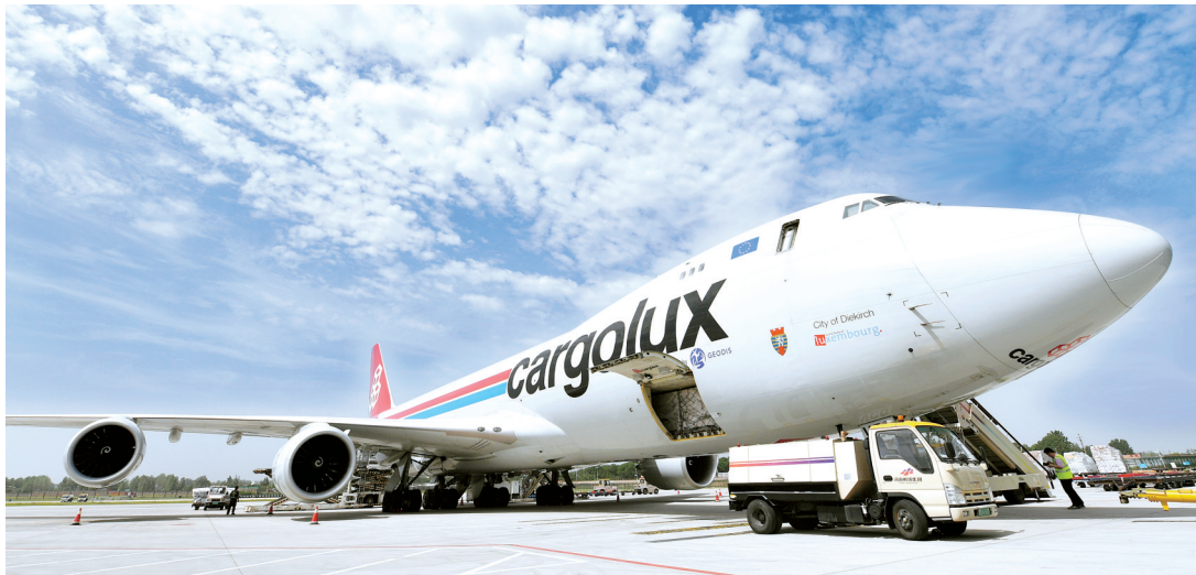
郑州航空港区卢森堡国际货运航班

飞机从空中降下落地,在滑行道上慢慢减速,轰鸣声随之消失。波音747的巨大机头缓缓张开,甫一停稳,工人们操纵起升降机卸货。记者前不久随国家发展改革委、外交部主办的“一带一路”国际合作典型项目研讨会来到郑州机场,看到这一幕。