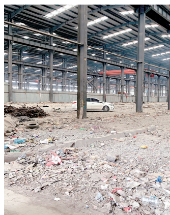
管城区紫东钢铁工业园

里有 5000 平方米黄土裸露没有覆盖到位,在没有采取任何降尘措施情况下,一台挖掘机正在进行施工。