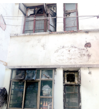
伊河路桐柏路口西墙立面剥落