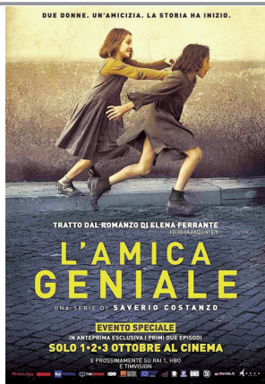
《我的天才女友》海报

开幕式结束后，易斯顿美术学院服装与服饰设计专业带来了2019届服装毕业作品动态发布会。学生们发布近80套设计作品，给大家带来了一场精彩纷呈的T台秀。据了解，该校部分毕业生已经在毕业设计期间进行了设计师品牌的规划，在完成毕业作品的同时开启自己的就业创业之路。