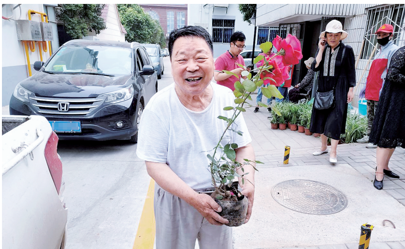
居民领到志愿者送来的绿植