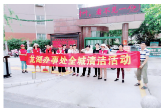
达到了预期的整治效果。

行动中,办事处精心部署,组织二三级路长、协管员、志愿者等对辖区绿化带内的垃圾、杂草进行铲除清理,对楼道前的暴露垃圾、乱堆乱放、卫生死角、积水容器、蜘蛛网、小广告等进行了“搬家式”的大扫除。同时积极动员居民、沿街商户及各村(社区)辖区单位共同参与“全城清洁”行动中来,彻底改善辖区的环境卫生状况,