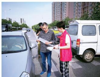
物行为,深入推进辖区道路环境提升,营造文明出行的道路交通环境。

“周末两天时间,我们就发放宣传传单近千份,制止车窗抛物行为17起。”办事处文明办工作人员告诉记者。下一步,商都路办事处将加大引导力度,扩大宣传范围,以常态长效整治车窗抛