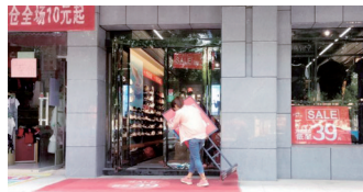
加大对夜间出店经营巡查整改力度,进一步规范经营秩序,还居民一个整洁有序的市容秩序。

频次,确保及时取缔无证摊点经营,规范店面入店经营。此外,各路队加大宣传力度,耐心向经营者宣传城市管理相关规定及占道经营带来的危害,引导他们意识到自身行为的错误,主动停止违规经营行为。截至目前,共教育劝导突店经营商户80余家,整治占道经营30余处。下一步,龙子湖街道办事处将在巩固前期整治效果的基础上,持续