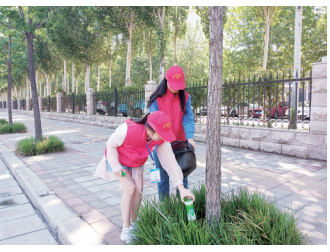
新治理工作的一个有力举措。下一步,社区将发展壮大志愿服务队伍,为辖区发展增添助力。