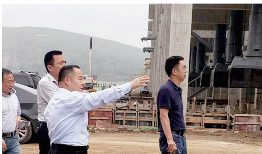
专家指导绿色矿山建设工作

为促进绿色矿山建设工作,荥阳邀请国家、省、郑州市专家前来指导工作,并组织企业负责人参加专项培训会议,进一步明确绿色矿山建设标准,把绿色矿山建设工作落到实处。