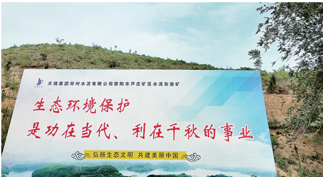
荥阳南部矿山生态修复取得阶段性成效