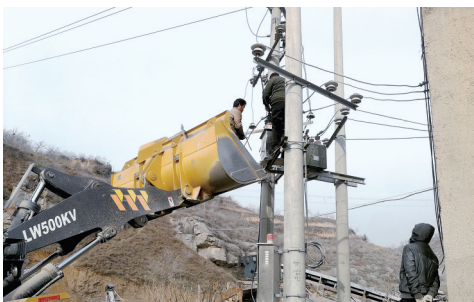
确保治理成效,对采矿权到期的矿山企业停电