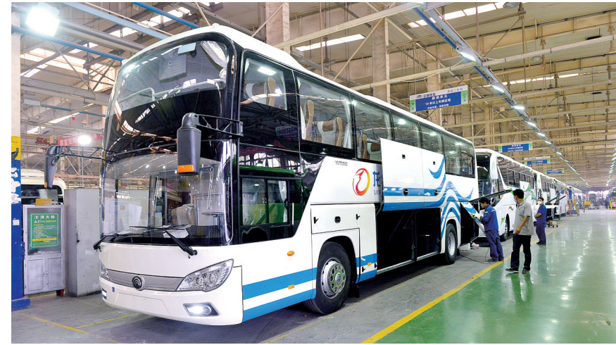
宇通客车生产线