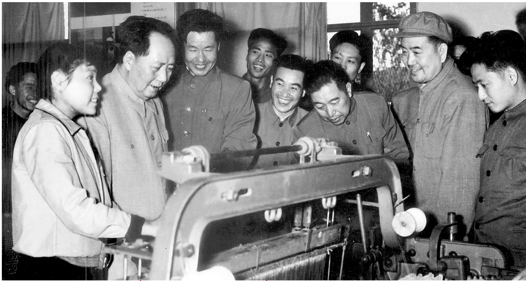
毛主席看四厂无梭织布机