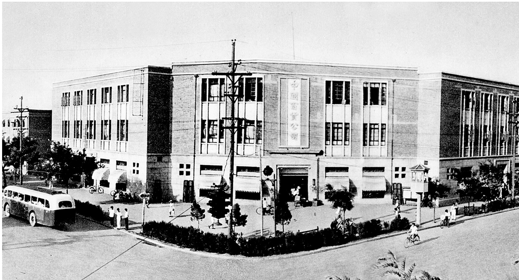
20世纪50年代郑州百货公司