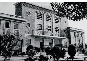
当年的工人文化宫