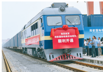
郑欧货运班列开通

“四条丝路从郑州出发”郑报全媒体大型实地探访活动,是郑州报业集团为庆祝新中国成立70周年,以及与共和国同龄的《郑州日报》《郑州晚报》创刊70周年的创意之一,被社会各界广泛关注。空中、陆上、网上、海上“四条丝路”已经成为今日河南对外开放的新高地。郑州肩负着建设发展好“四条丝路”、引领河南开放发展的历史使命和时代担当。 郑报全媒体记者 侯爱敏/文 丁友明/图