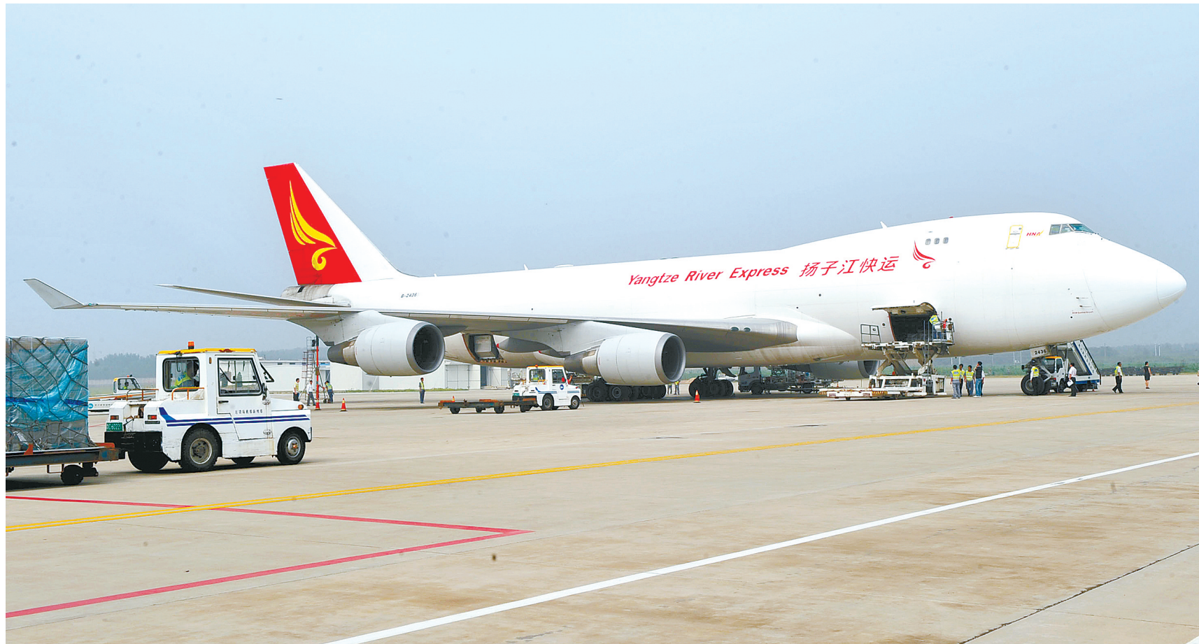
一条条新航线开通让郑州通往世界各地