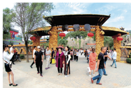
“中国最美乡村”新密市黄固寺村