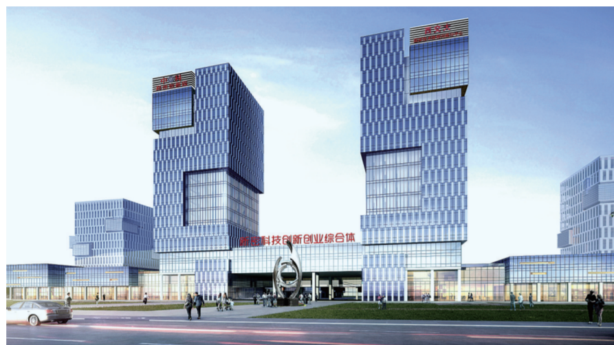
新密科技创新创业综合体

目前,新密市已有景区13个,国家4A、3A级景区达8个,居郑州市(市)第一位。伏羲大峡谷景区、三泉湖景区、红石林景区先后被评为国家4A级景区。米村镇荣获省特色生态旅游示范镇,尖山楼院村被授予省乡村旅游特色村。2018年,全年接待游客758.3万人次,增长34.8%,旅游综合收入51.2亿元,增长73.8%。乡村旅游和文化产业迸发出强劲动力。