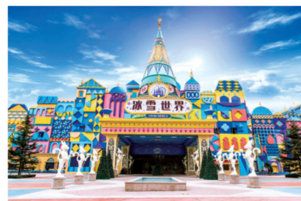
银基国际旅游度假区“冰雪世界”