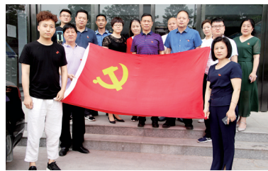
荥阳市城管局开展党员活动日活动