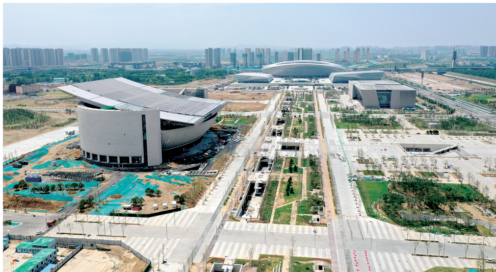
7月30日,建设中的CCD地下商业街 郑报全媒体记者 马健 图