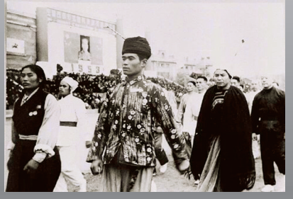
运动员走过主席台前