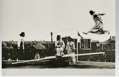
东北区朝鲜族运动员表演的“跳板”