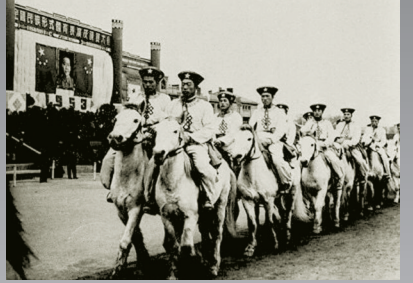
蒙古族运动员的马队行列