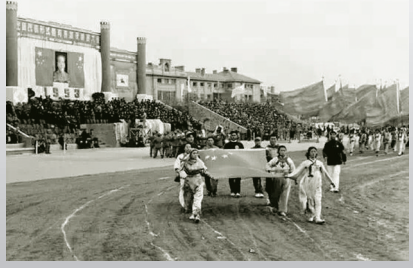
1953年全国民族形式体育表演及竞赛大会入场式