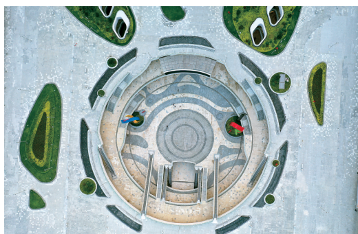
换个角度看奥体中心