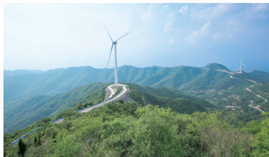
蜿蜒山路——宣化荟萃山