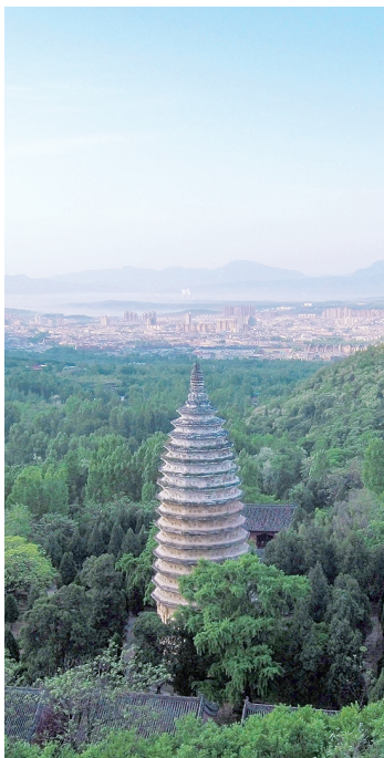
换个角度看嵩岳寺塔