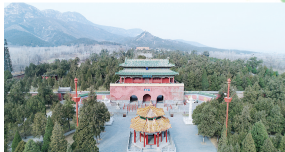
背依黄盖峰的中岳庙