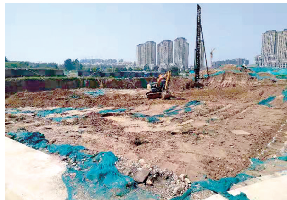
锦艺四季城香晴苑项目黄土裸露

本报讯 8月15日,记者跟随郑州市污染防治督导组联合执法一处对惠济区的一些工业企业及建设项目进行了明察暗访,发现锦艺四季城香晴苑约300平方米黄土裸露、车辆冲洗设施损坏未及时修复,郑州新港源汽车服务有限公司粉尘污染问题突出等问题。