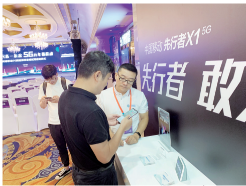
体验5G手机中国移动先行者X1