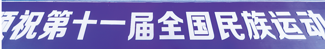
河南移动5G网络郑州全城试用