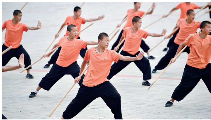
少林友谊学校的学生们正加紧练习，他们将于9月9日在嵩山少林寺门前表演，迎接民族运动会登顶活动的到来