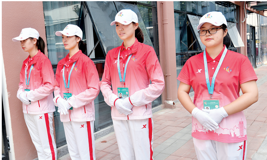
第十一届全国民族运动会赛会志愿者

根据《意见》,到2025年,注册志愿者人数达全市常住人口15%,基本建成与经济社会发展相适应,布局合理、管理规范、服务完善、充满活力的志愿者队伍和志愿服务组织体系。志愿组织发展环境得到优化,志愿服务范围不断扩大,服务设施不断完善。推进志愿服务组织依法登记,健全志愿服务组织孵化机制,积极推进志愿服务组织承接公共服务项目,完善志愿服务组织监督管理,形成有社会影响力和示范效应的志愿服务品牌。 郑报全媒体记者 李娜