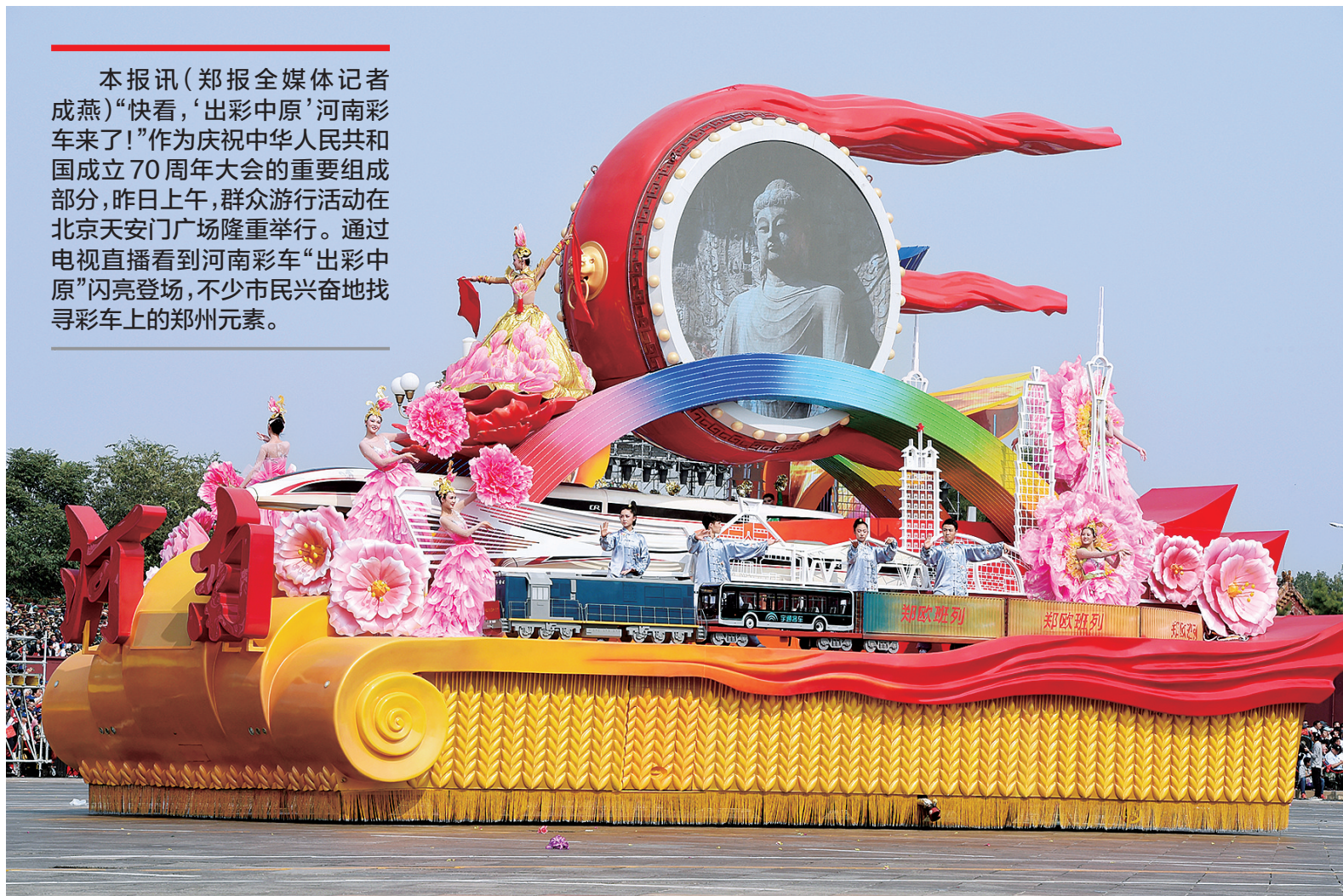
10月1日上午,庆祝中华人民共和国成立70周年大会在北京天安门广场隆重举行。这是群众游行中的“出彩中原”河南彩车

本报讯(郑报全媒体记者成燕)“快看,‘出彩中原’河南彩车来了!”作为庆祝中华人民共和国成立70周年大会的重要组成部分,昨日上午,群众游行活动在北京天安门广场隆重举行。通过电视直播看到河南彩车“出彩中原”闪亮登场,不少市民兴奋地找寻彩车上的郑州元素。