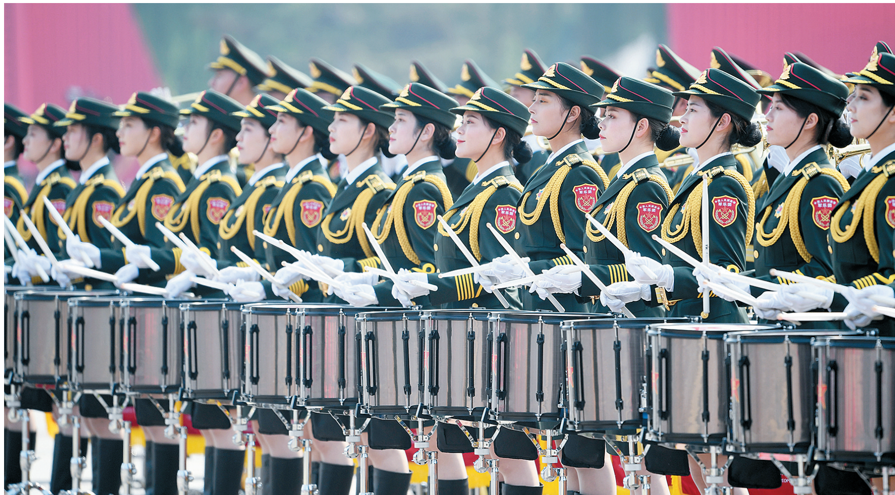
10月1日上午,庆祝中华人民共和国成立70周年大会在北京天安门广场隆重举行。这是联合军乐团在演奏。