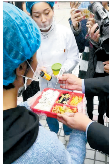
检测人员在给食物取样

本报讯(郑报全媒体记者 李爱琴 通讯员 赵正银 文/图)目前,郑州二七区的小学陆续在实行午餐集中配送。为加大对集中配送午餐的监管力度,切实保障学生饮食安全,二七区市场监管局配合二七区教育体育局对辖区内各小学午餐供餐食品安全情况进行了不断督导检查。