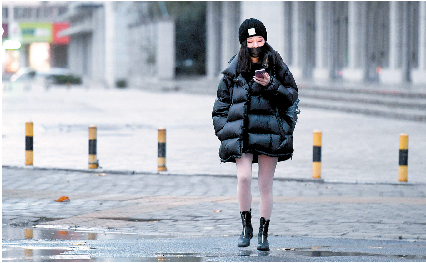
17日傍晚,小雨中的郑州温度进一步下降,不少行人都穿上棉袄、羽绒服,郑州有了冬天的感觉