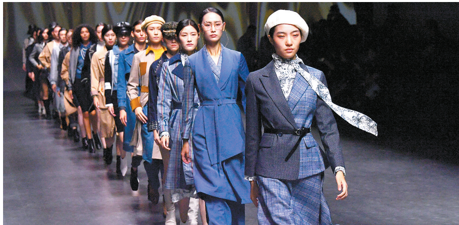
为原创设计力量喝彩,郑州国际时装周上模特走秀