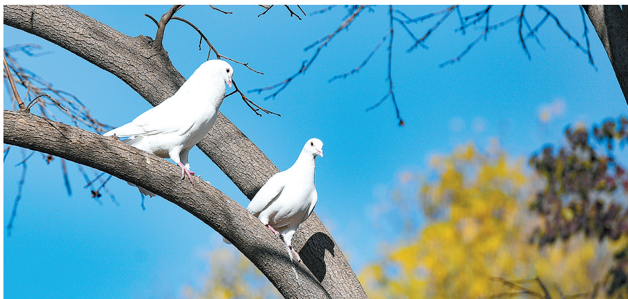
昨日,紫荆山公园,两只鸽子在树上晒太阳

另外,2019年全省大部秋季日较常年偏长。河南各地入秋时间集中在9月11日~15日,多正常入秋,仅焦作入秋偏早7天,而入冬时间多偏晚,造成全省秋季日数均超过60天,豫东、豫南超过70天,造成各地秋季日数较常年偏多1天(商丘)~17天(开封)。