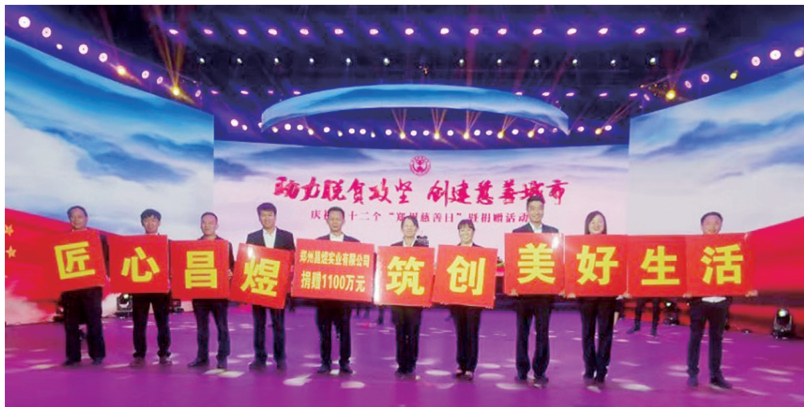
郑州慈善日,捐款1100万元