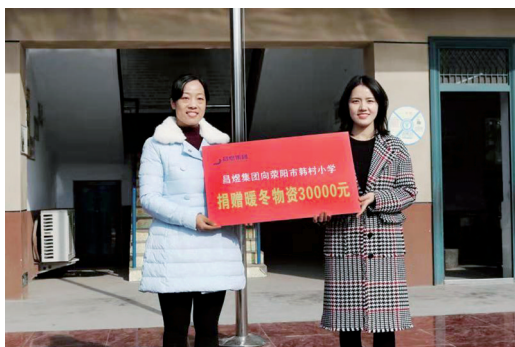
向韩村小学捐赠暖冬物资