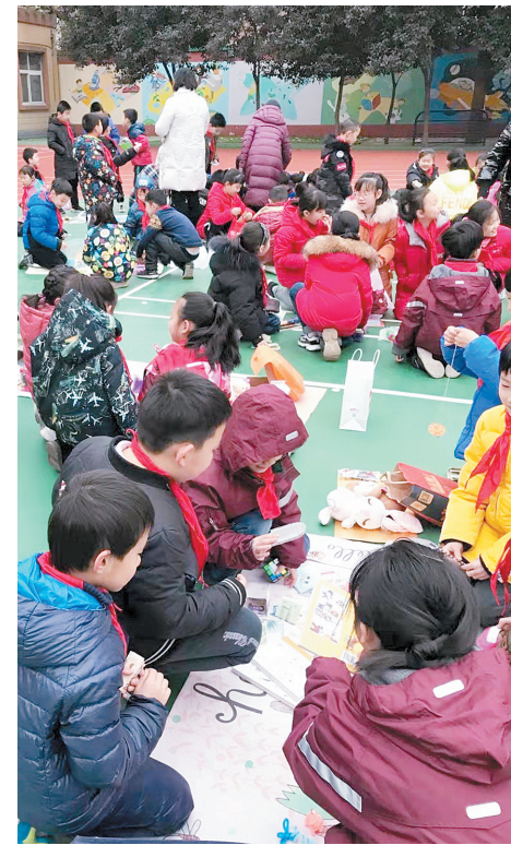
优胜路小学义卖现场

此次活动所得的钱将用于爱心活动和公益事业,还将用于对助学结对希望小学的捐助,为生活有难处的孩子们送去一份关爱。