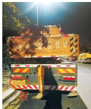
路两侧停放的两辆车,一辆挂真牌,一辆挂假牌

本报讯(郑报全媒体记者张玉东 通讯员 张二朋 文/图)两辆重型非载货作业车,一东一西停在路两侧,车牌一模一样!近日,交警五大队在开展冬季交通安全整治行动时,发现一起明目张胆的涉牌涉证违法行为。