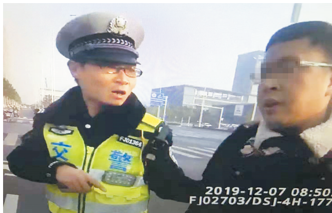
黄某辱骂执勤交警