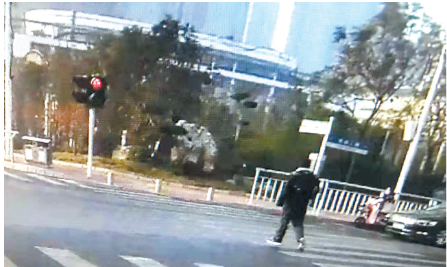
黄某路口闯红灯(视频截图)