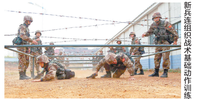
新兵连组织战术基础动作训练