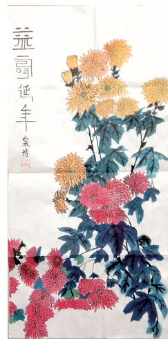
苏泉博 石道乡初级中学 七年级六班