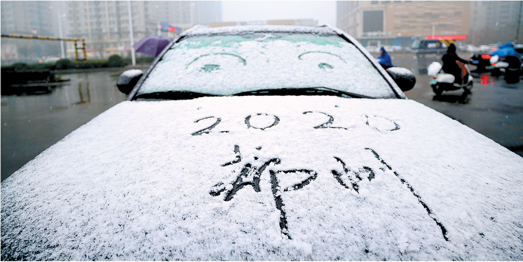
航海路上,白雪落在汽车上,成了一车风景。