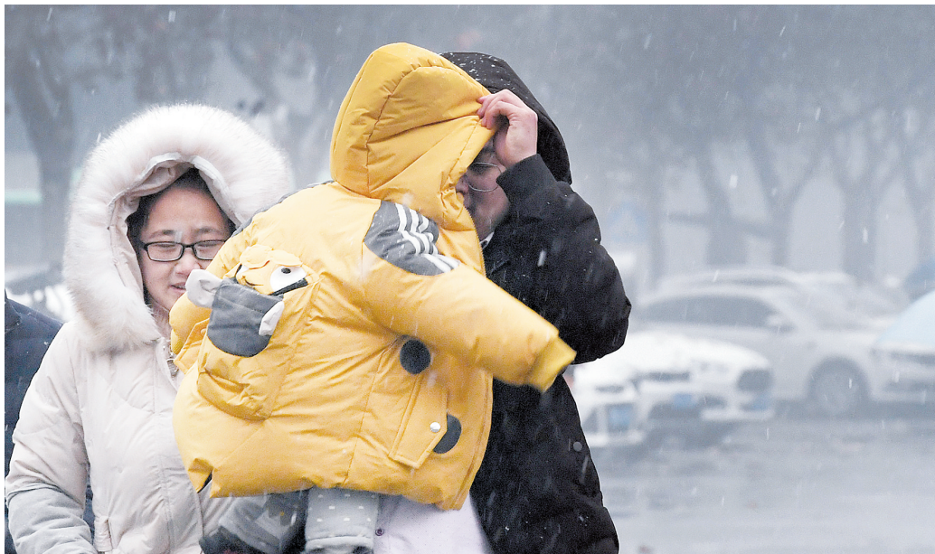
文化路上,一位抱着孩子的家长拉着衣帽为孩子遮挡雨雪