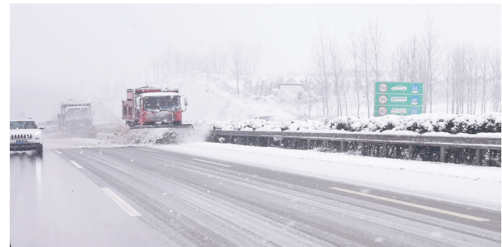
三门峡高速交警支队加紧除雪融冰,确保道路安全通畅

本报讯(郑报全媒体记者 张玉东 通讯员 杨军政 文/图)为有效应对雨雪恶劣天气,昨日,省公安厅高速交警总队联合省交通运输厅高管中心提前部