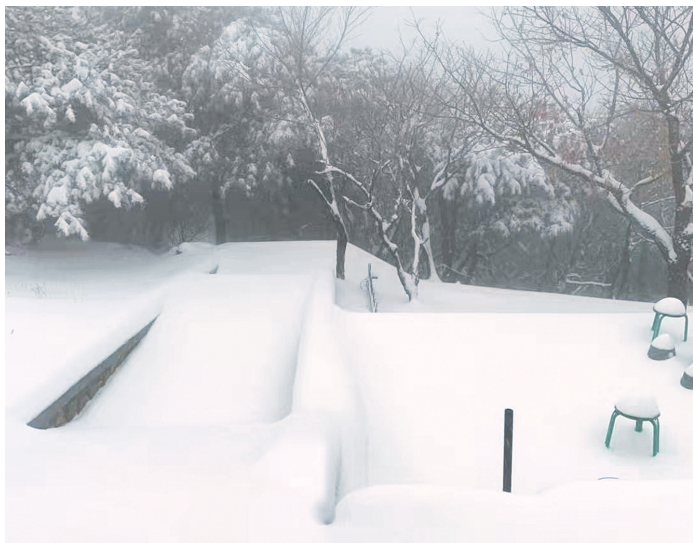
嵩山气象站积雪达16厘米厚

据郑州市气象台预报,今日白天阴天有小雨或雨夹雪;今日夜里,中雨夹雪转中到大雪;偏北风2~3级,最高气温:3℃~4℃,最低气温:0℃~1℃。受地面冷空气和高空西南气流共同影响,今日夜里到明天白天雨夹雪转为纯雪,风力逐渐加大到4级。受强冷空气影响,周三凌晨最低气温下降至-7℃;周五夜里到周六白天还有一次降雪天气。周内气温较低,最高气温3℃,最低气温-8℃。