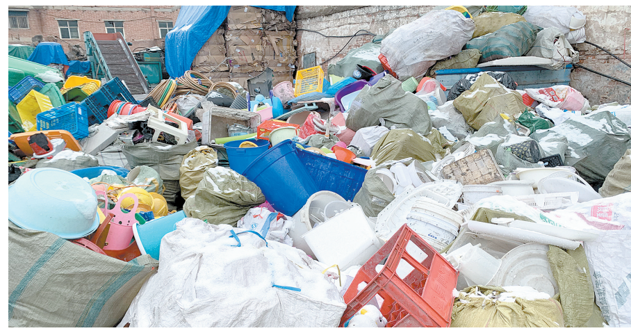
大面积回收物品裸露