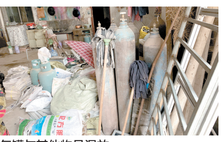
气罐与其他物品混放

惠济区福利院路沙口路口一无名废品收购站,执法人员检查时正在经营,不能提供任何手续,居住、生活与回收废品、气罐未隔离,存在较大安全隐患。 高新区石佛村党群服务中心对面一家无名废品收购站规模较大,内设地磅一台,露天打包生产线一条,回收物品约3000平方米露天存放。尽管该废品收购站现场未经营,但鉴于发现的问题,加之其不能提供任何手续,执法人员现场开具交办单,要求属地政府依法依规处理,5日内将处理情况书面回复至市督导组。