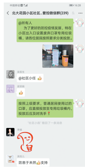
依托微信平台传达防疫要求