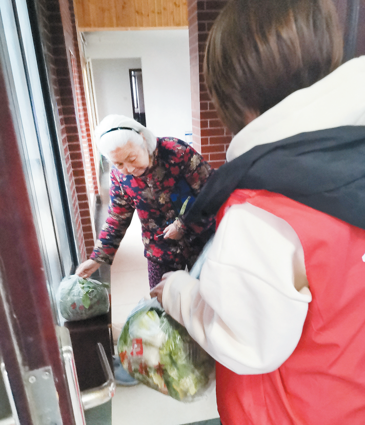
志愿者将居民预约采购的蔬菜送上门