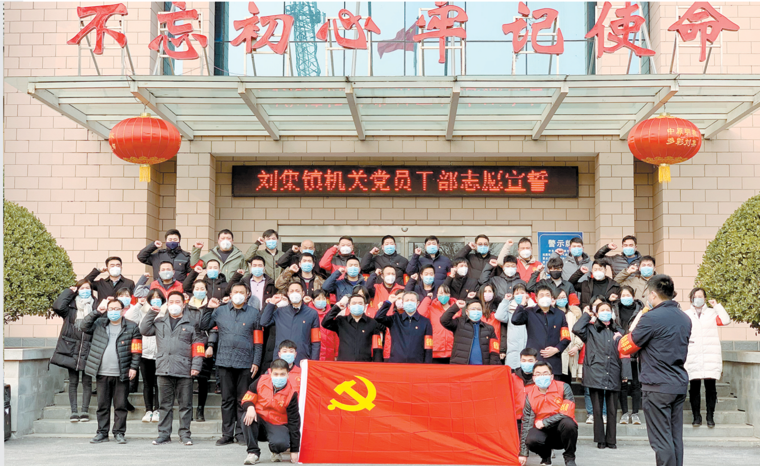
刘集镇政府全体党员集体宣誓抗击疫情