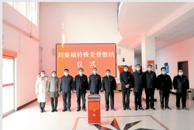
刘集镇全体班子成员缴纳特殊党费