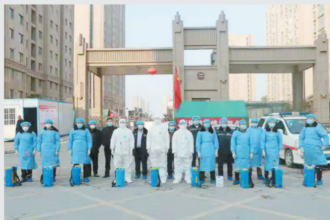
刘集镇中心卫生院医务人员集中对社区进行消杀