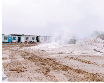
二七垃圾转运站和分拣中心

本报讯(郑报全媒体记者 张玉东 朱钰玮 郑州电视台记者 王京 文/图)3月9日,记者跟随郑州市污染防治督导组联合执法一处,对二七区7处工业企业、建设项目进行检查。